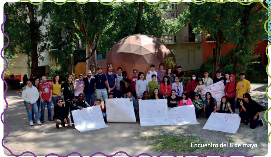
Encuentro del 8 de mayo

Además de formarse, la Escuela también es un espacio para fortalecer el tejido social, conociéndonos y compartiendo entre las distintas asociaciones, edades, orígenes... y conociendo los diversos movimientos sociales de la ciudad. Para ello, realizamos este primer encuentro donde nos Enredamos durante la mañana del 8 de mayo en una gymkana por las calles del Casco Viejo de Iruñea, partiendo y acabando en la Plaza Santa Ana. Las participantes recorrieron diferentes puntos donde «nuestra ciudad se enferma por el capitalismo, el machismo, el racismo... y donde se sana y cura gracias a las alternativas que cuidan la vida desde los feminismos, la vida comunitaria, el consumo responsable, las energías limpias...» a tra-