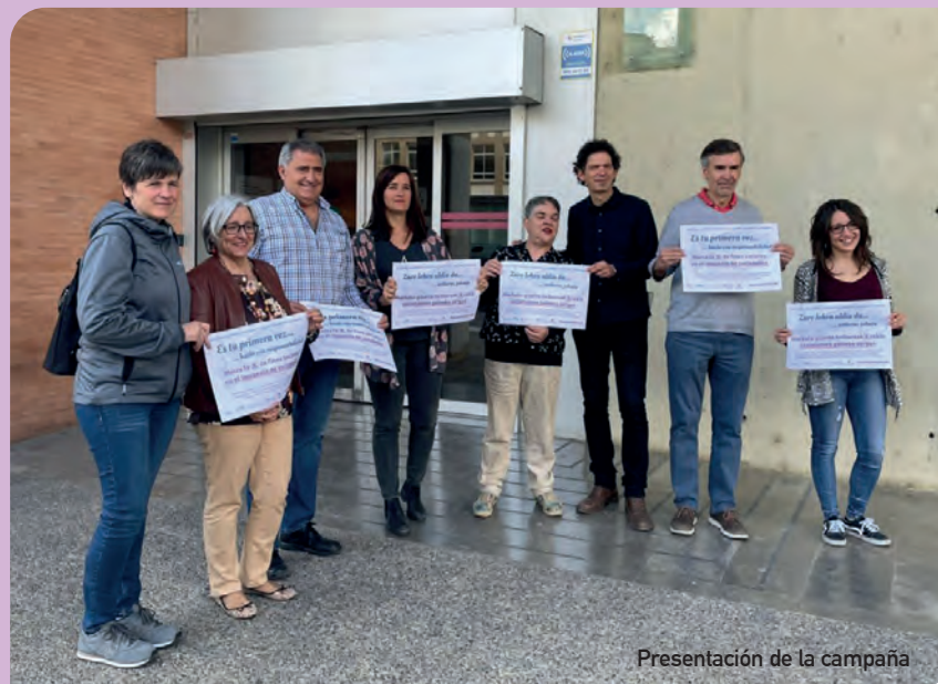
Presentación de la campaña

De esta manera, pueden marcar la casilla sin perjuicio alguno de sus intereses, pues no incrementa la cuantía del impuesto, se comprometen de forma directa con la solidaridad y la atención de las personas más vulnerables de Navarra y también de otras zonas del mundo, gracias a la cooperación internacional. Si todas las empresas navarras decidieran aportar su parte a los fines sociales, se podrían recaudar 2 millones de euros para financiar programas de apoyo de distintas entidades.